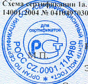
Схема сертификации 1а. Сертификат EN ISO 9001:2008 № 04100935005 от 07.08.2012 и сертификат EN ISO 14001:2004 № 04104970309 от 07.08.2012, выданные органом по сертификации систем качества TÜV NORD CERT